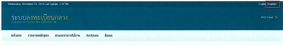
ภาพประกอบที่ 1