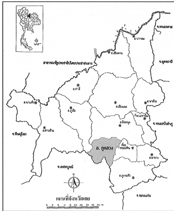
ขอบเขตพื้นที่ในการผลิตข้าวเหนียวแดงเมืองเลย ครอบคลุมพื้นที่อำเภอภูหลวงของจังหวัดเลย