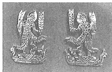
เข็มกระทรวงพาณิชย์