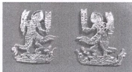
เข็มกระทรวงพาณิชย์