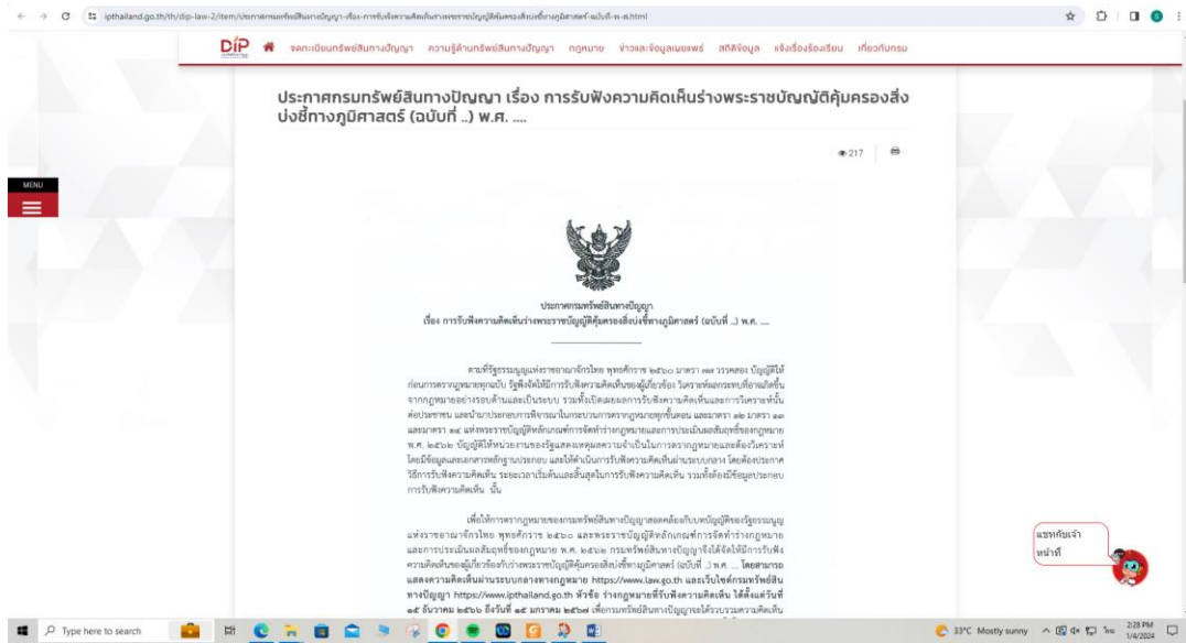
หน้าเว็บไซต์กรมทรัพย์สินทางปัญญา